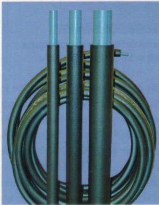
Flexalen 60 ist ein vorisoliertes Kunststoffsystem mit Mediumrohren aus PB

Bereich der Schweißformstücke aus Polybuten ist ein Meilenstein für die Verbesserung der Wirtschaftlichkeit von Abzweigen. Ein einziger Formteil ersetzt die bisher notwendigen T-Stücke und Reduktionen. Dieser neue Formteil ist